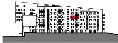
6. NADZEMNÍ PODLAŽÍ