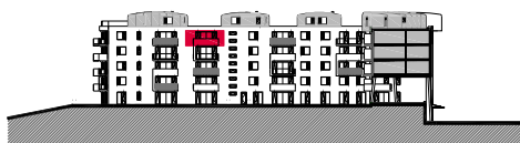
6. NADZEMNÍ PODLAŽÍ